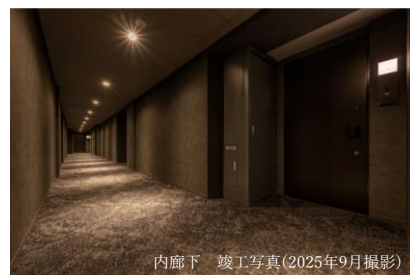
内廊下 竣工写真(2025年9月撮影)