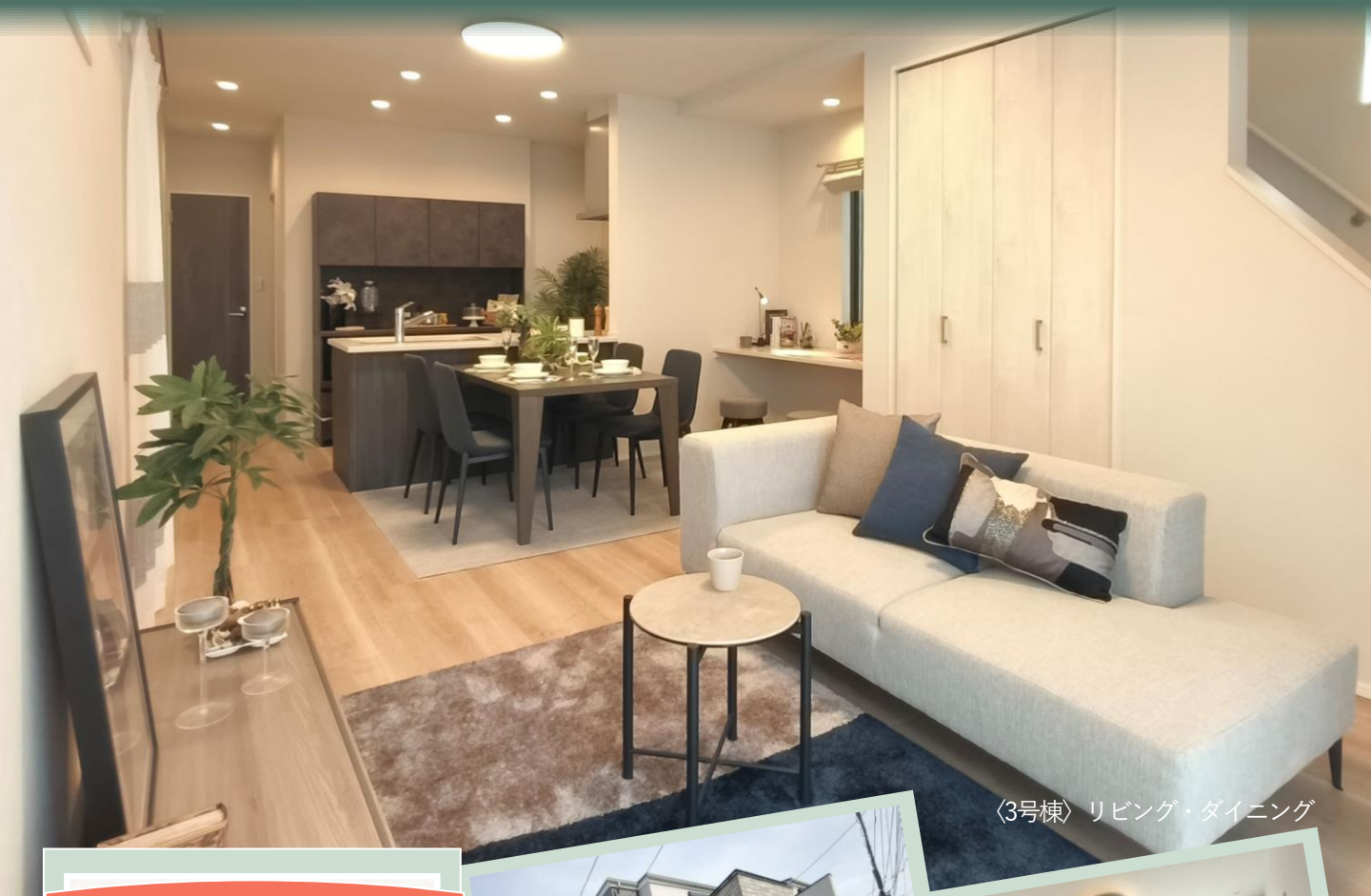
〈3号棟〉リビング・ダイニング