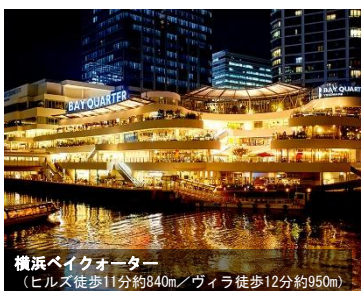
横浜ベイクォーター (ヒルズ徒歩11分約840m/ヴィラ徒歩12分約950m)