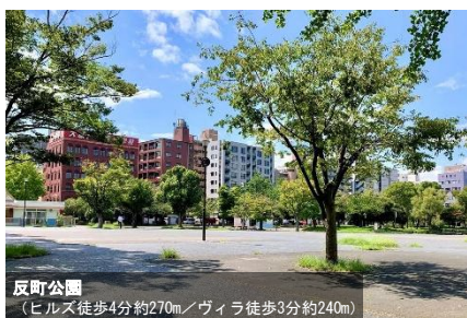
反町公園 (ヒルズ徒歩4分約270m/ヴィラ徒歩3分約240m)