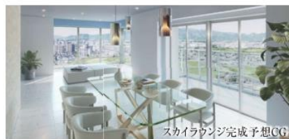
スカイラウンジ完成予想CG

※掲載の外観完成予想CGは、海老名市上郷北交差点付近(現地より約1,100m)より撮影した写真(2021年12月撮影)に計画段階の図面を組み合わせ作成した建物完成予想図をCG作成・加工したもので、実際とは異なります※掲載の完成予想CGは設計段階の図面を基に描き起こしたもので、実際とは異なります